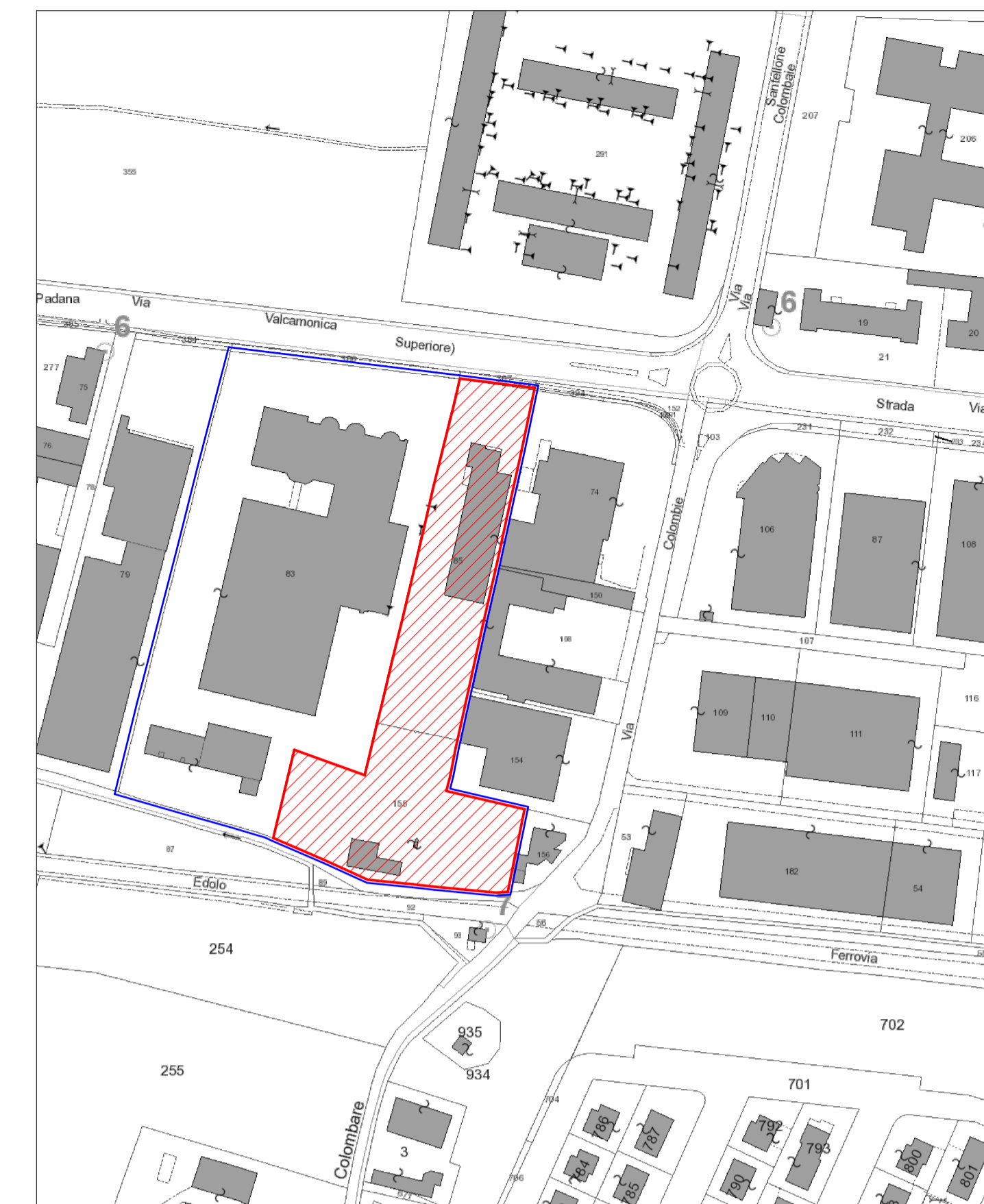
ESTRATTO DI MAPPA_foglio 77 particelle 85,155 scala 1:1.000