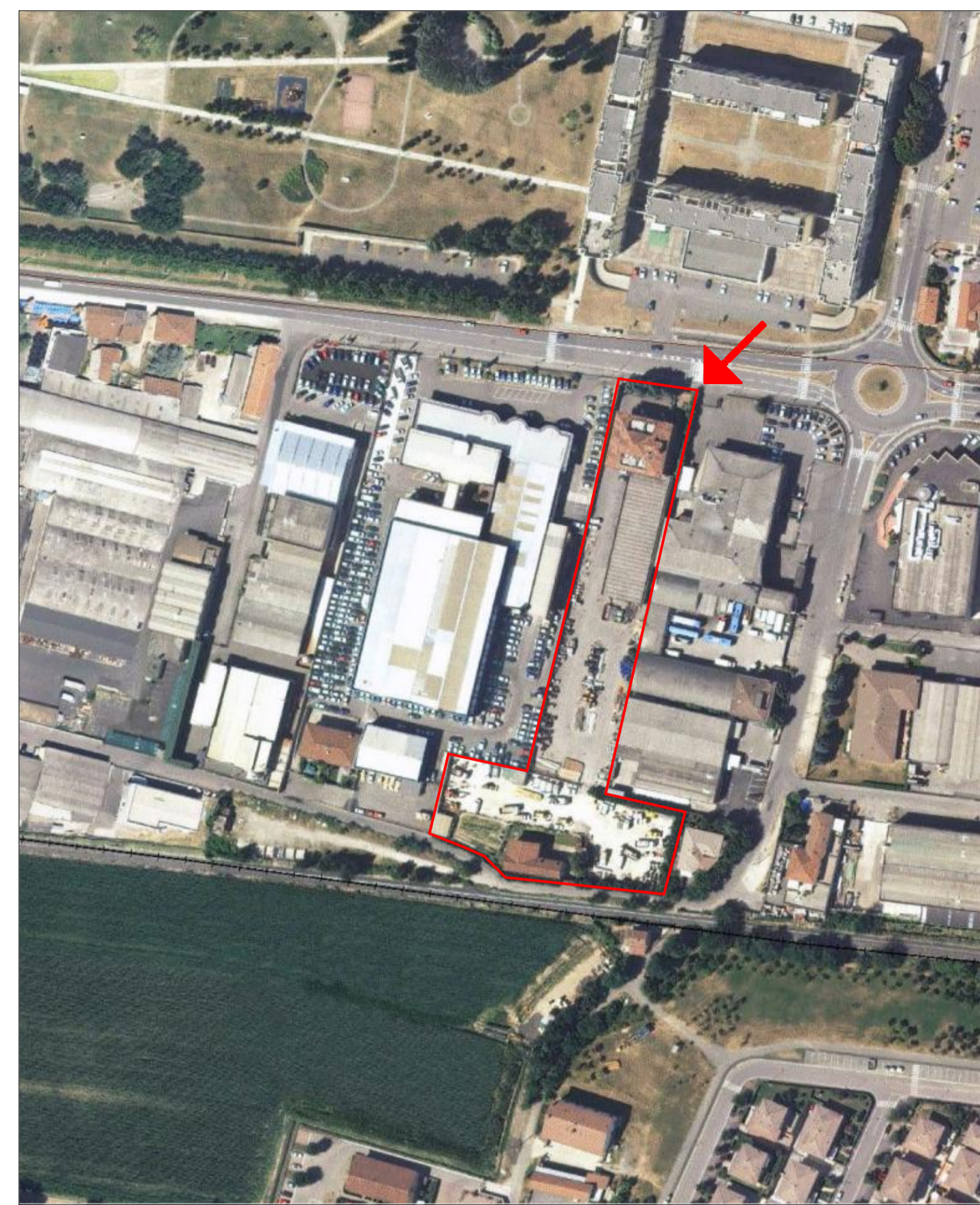
ORTOFOTO Cartografia Geoportale Provincia di Brescia scala 1:2.000