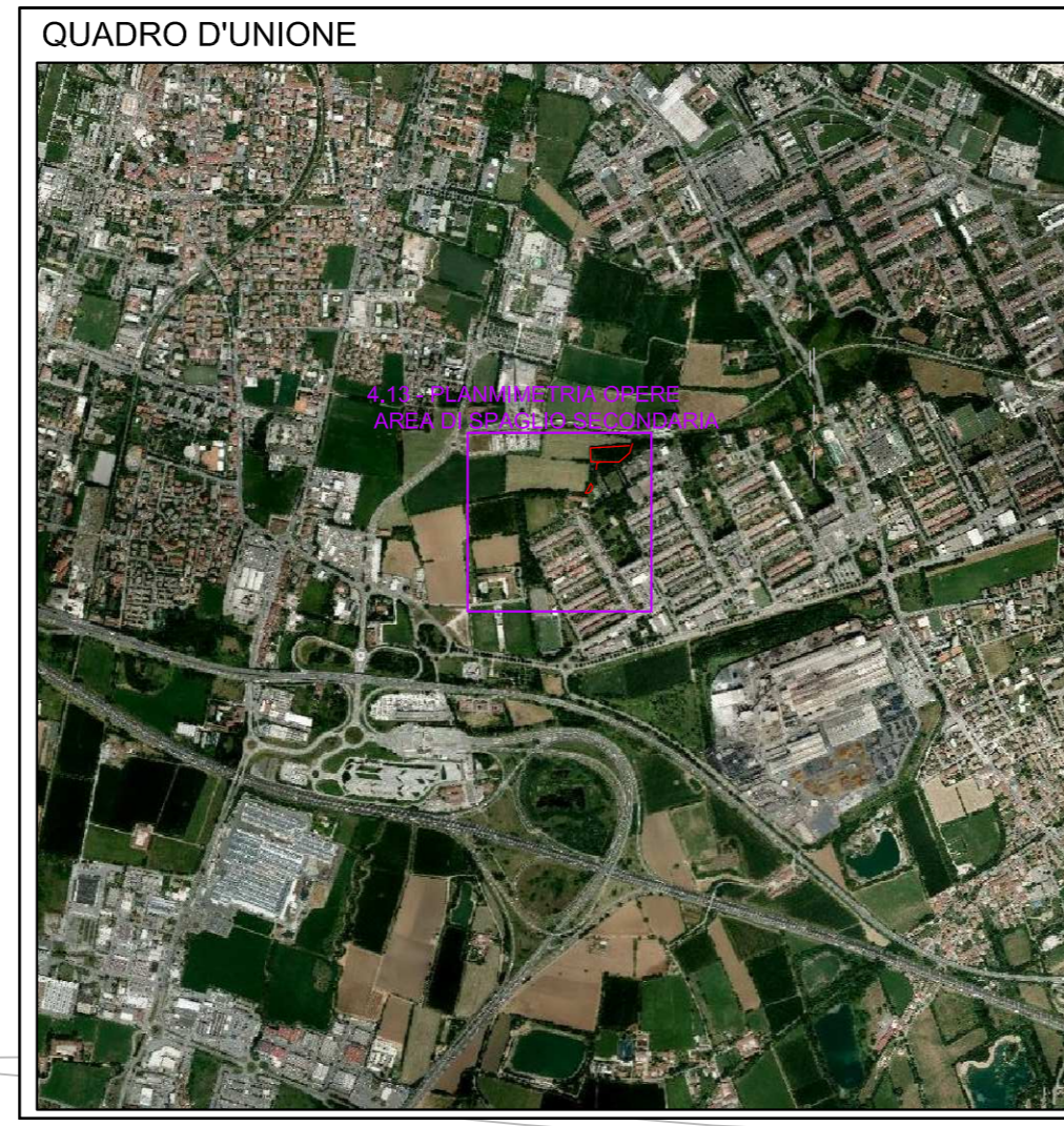
PLANIMETRIA - 1: 500

A tutela del lettore il presente documento è di proprietà di Brescia Infrastrutture S.r.l. e non potrà essere spedito o trasmesso, anche parzialmente, o terzi senza una precisa autorizzazione della stessa.