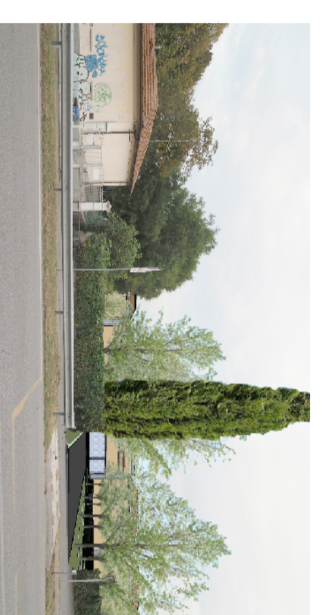
Simulazione 3 - vista su via Flero