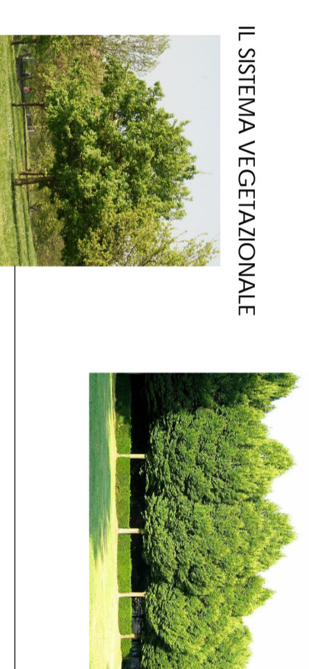
IL SISTEMA VEGETAZIONALE