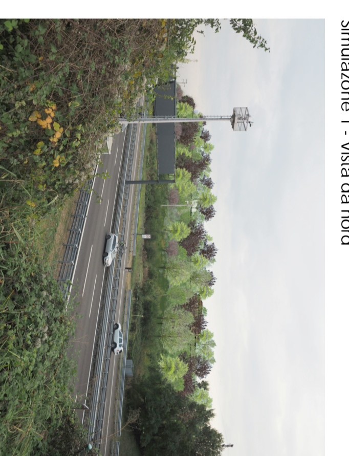
Simulazione 1 - Vista da nord