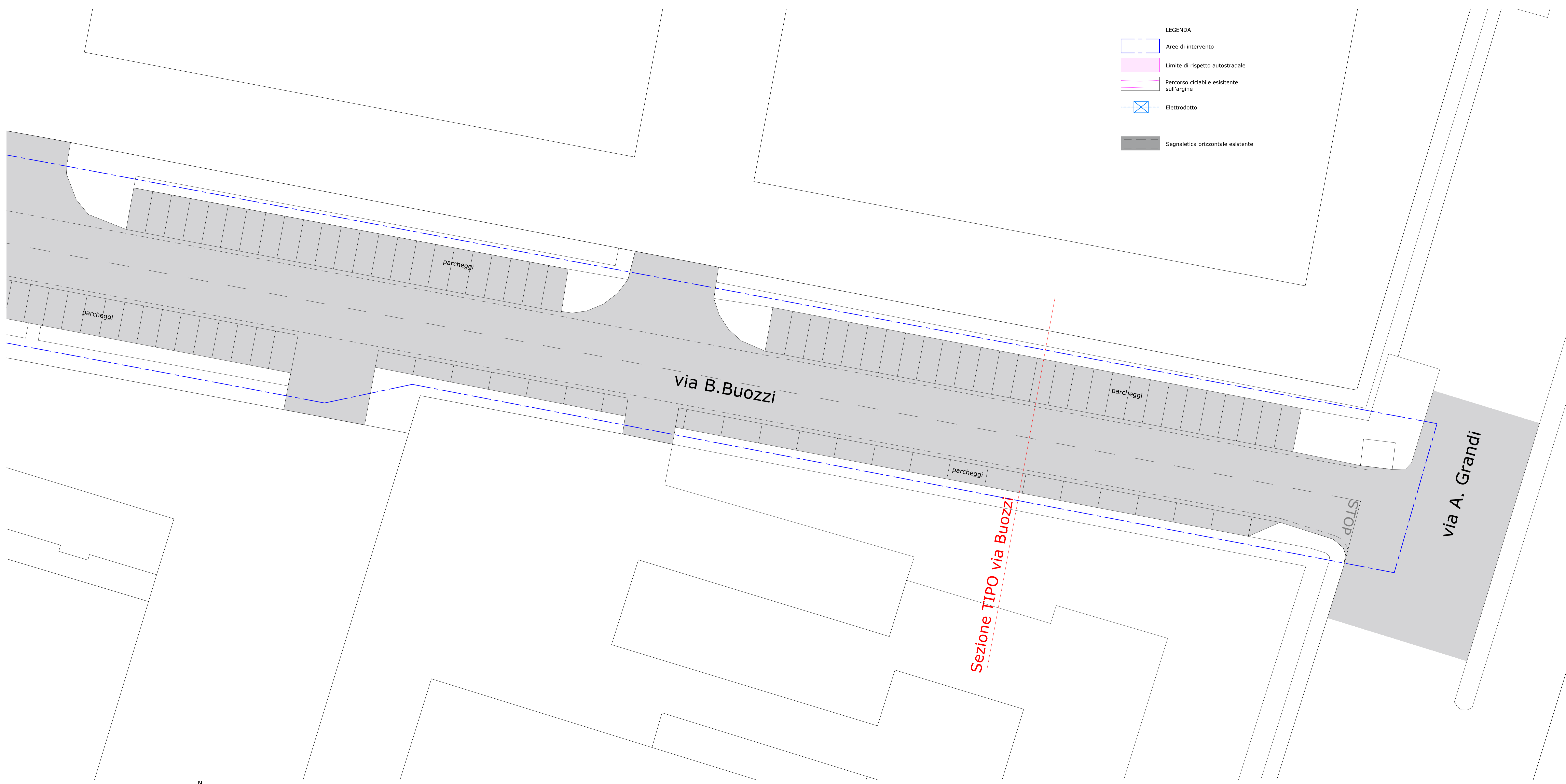
PIANTA - quadro L - scala 1:200