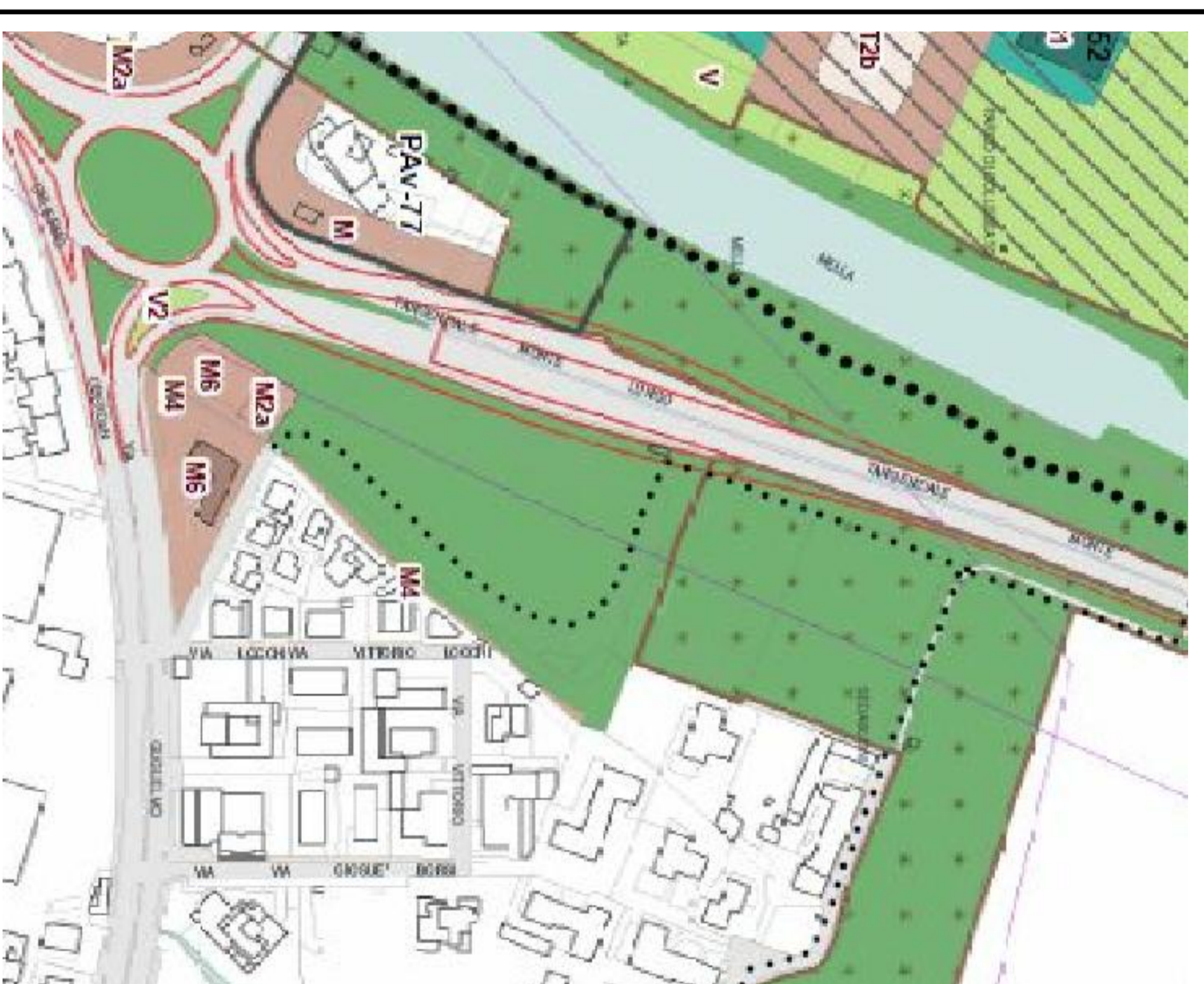
ESTRATTO PGT - NUOVA PISTA CICLOPEDONALE SCALA 1:2000