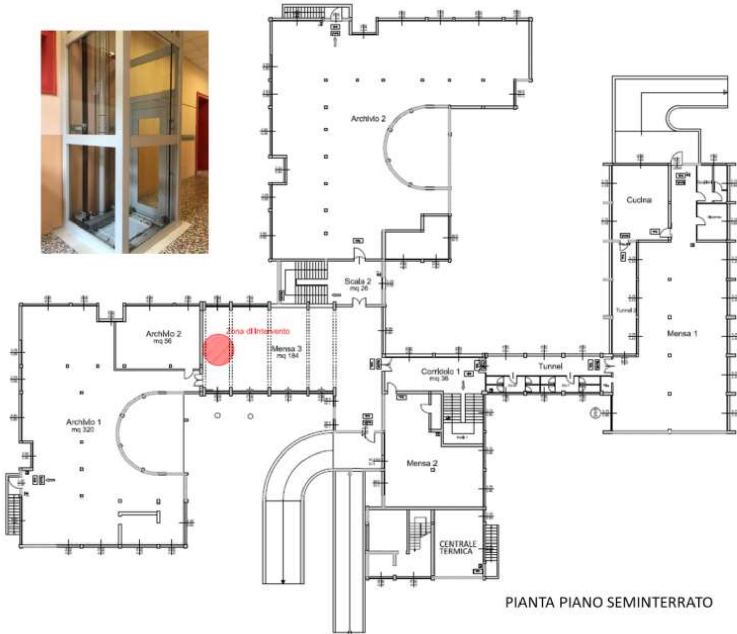
PIANTA PIANO SEMINTERRATO