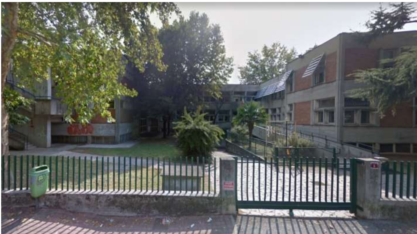
Vista facciata principale.