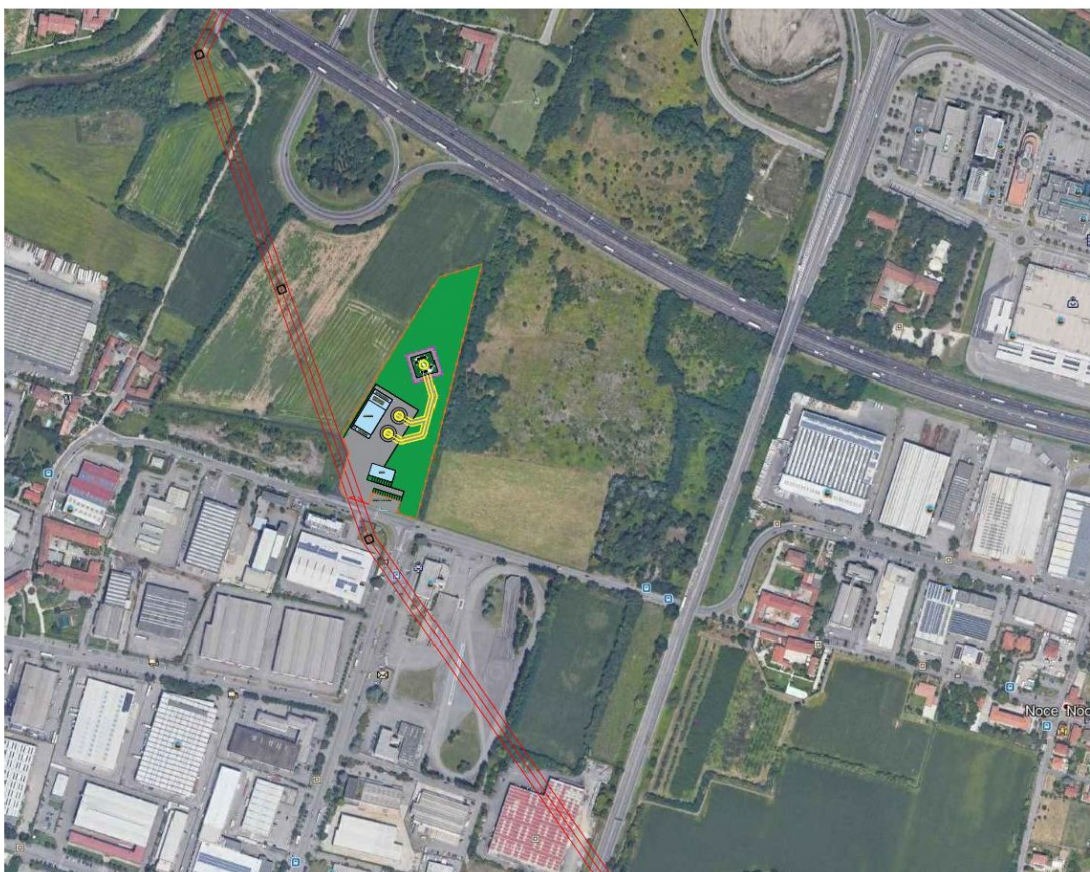
In rosso il tracciato delle linee elettriche

Per ogni ulteriore riferimento si rimanda al suddetto studio di fattibilità.