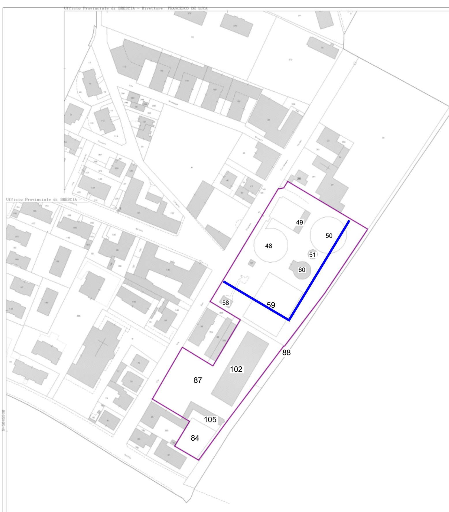
ESTRATTO CATASTALE - NCT FG. 40