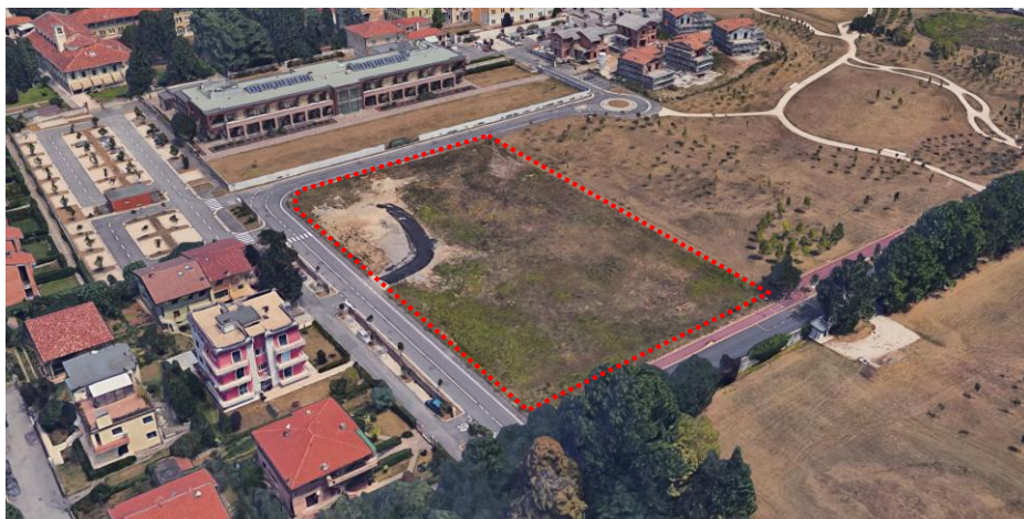
Vista aerea del comparto