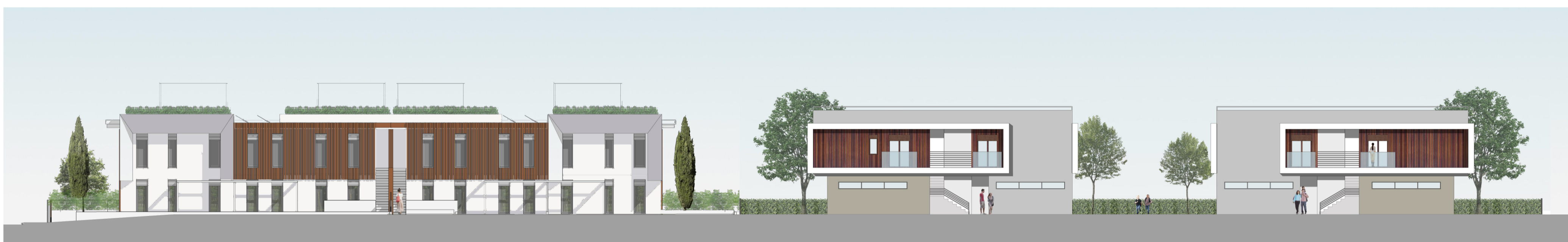
PROSPETTO OVEST INTERNO