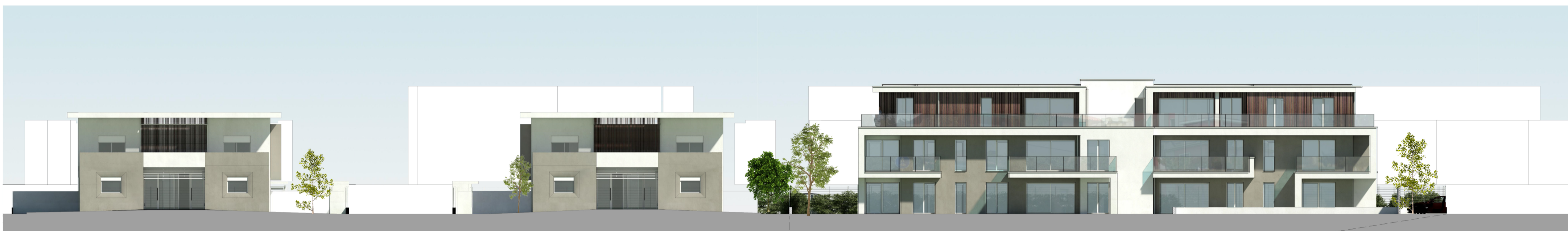
PROSPETTO EST INTERNO