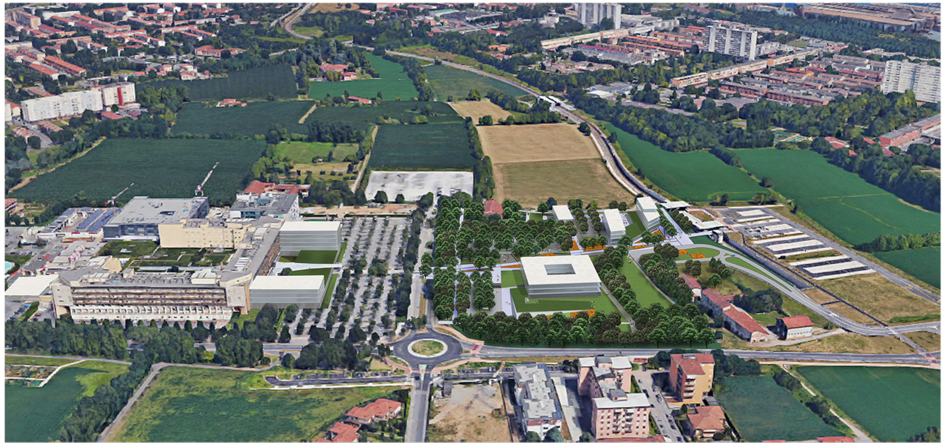
Viste prospettiche " Evocative"