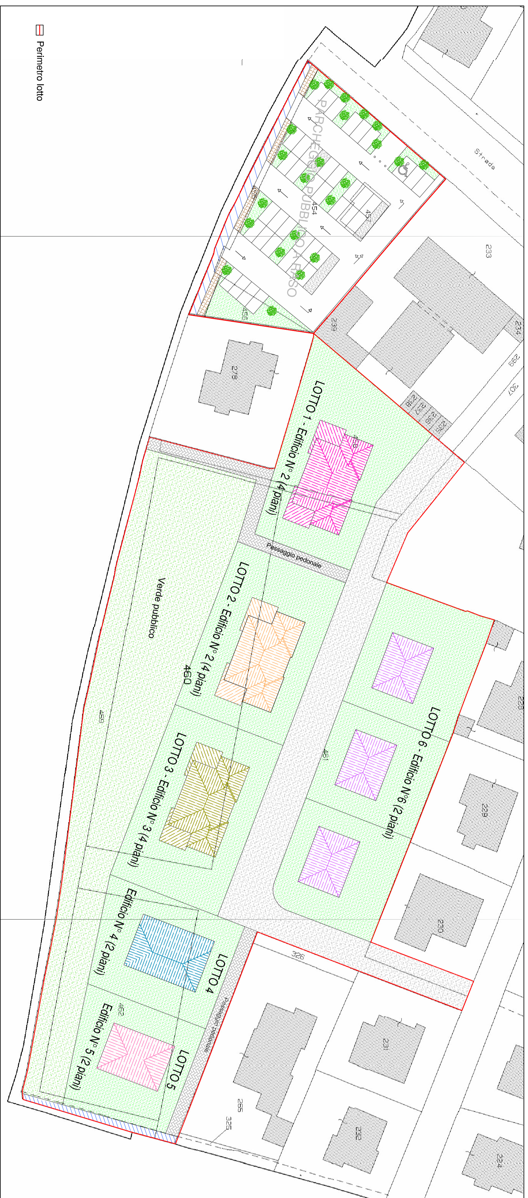
SOVRAPPOSIZIONE ESTRATTO MAPPA CATASTALE CON PLANIMETRIA DI PROGETTO - scala 1:500