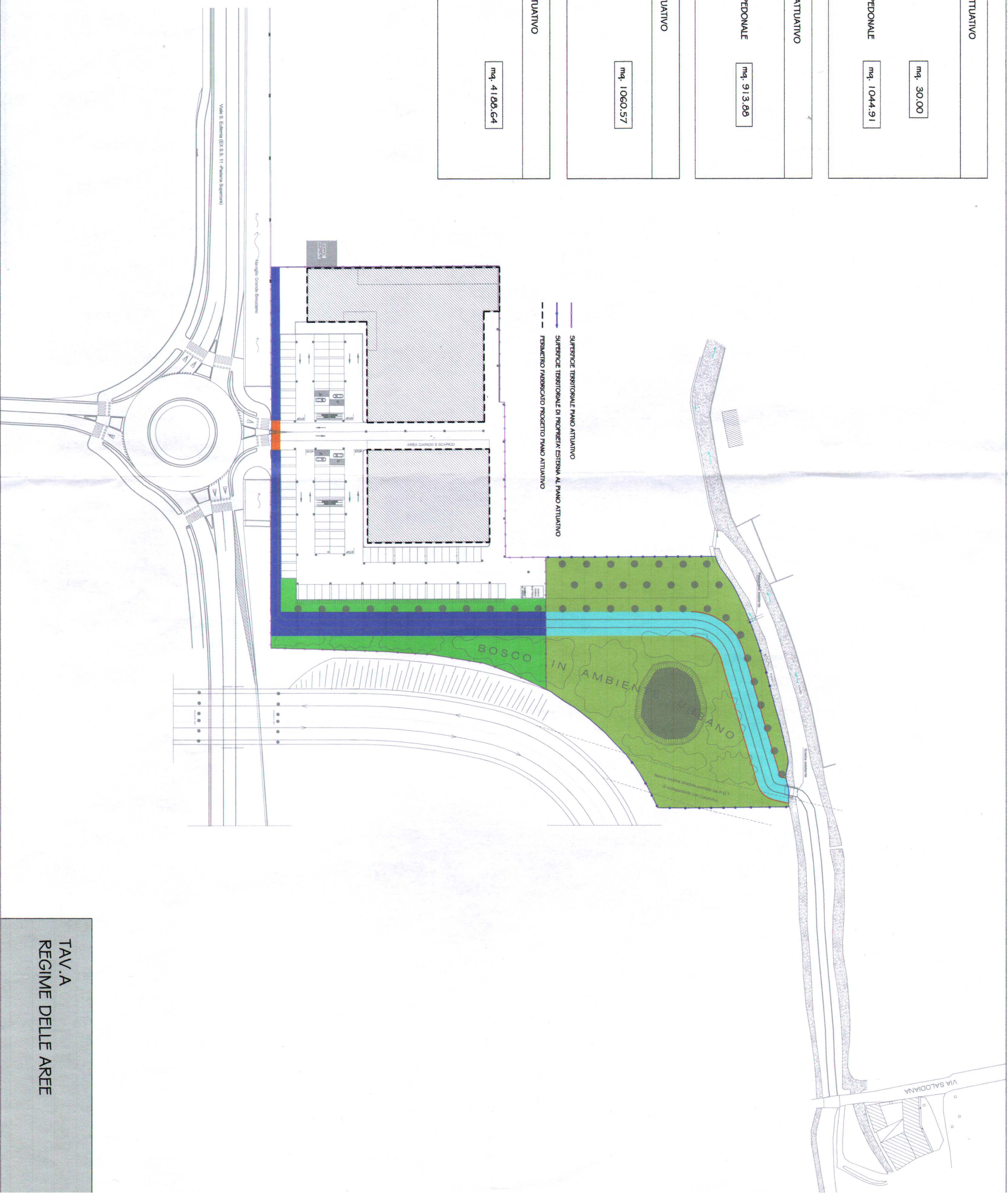
TAV. A REGIME DELLE AREE