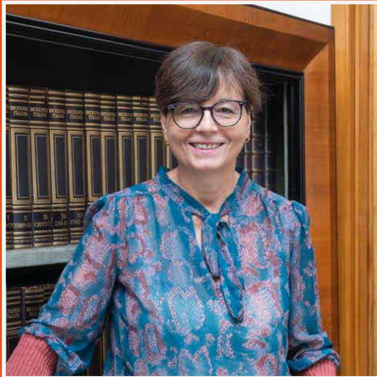
Maria Chiara Garrozza

Scienziata e accademica di fama internazionale, specializzata in bioingegneria, biorobotica e neurorobotica. Laureata in Fisica all'Università di Pisa e PhD in Ingegneria alla Scuola Superiore Sant'Anna, ha ricoperto importanti incarichi nel mondo della ricerca e dell'università tra i quali: Rettore della Scuola Superiore Sant'Anna di Pisa (2007-2013), Ministro dell'Istruzione, dell'Università e della Ricerca (2013-2014) e Presidente del Consiglio Nazionale delle Ricerche CNR (2021-2025). Autrice di numerose pubblicazioni scientifiche e titolare di brevetti internazionali è oggi una delle personalità più autorevoli nel campo della ricerca, dell'innovazione tecnologica e delle politiche per la scienza in Italia e in Europa.