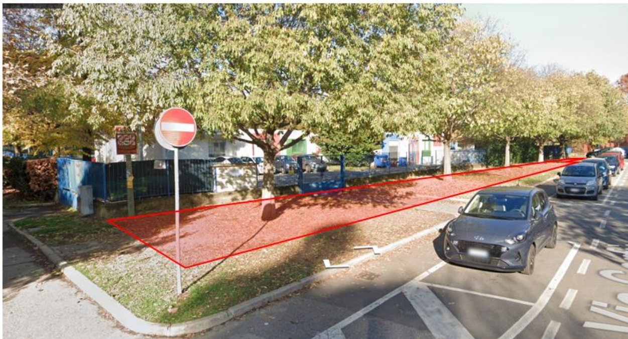
Superficie di ampliamento del Servizio I1 Istruzione di base

pertinenziale per funzioni ricreative della Scuola dell'infanzia contribuisce a dare qualità all'intervento edilizio ed al progetto educativo cui è destinato.