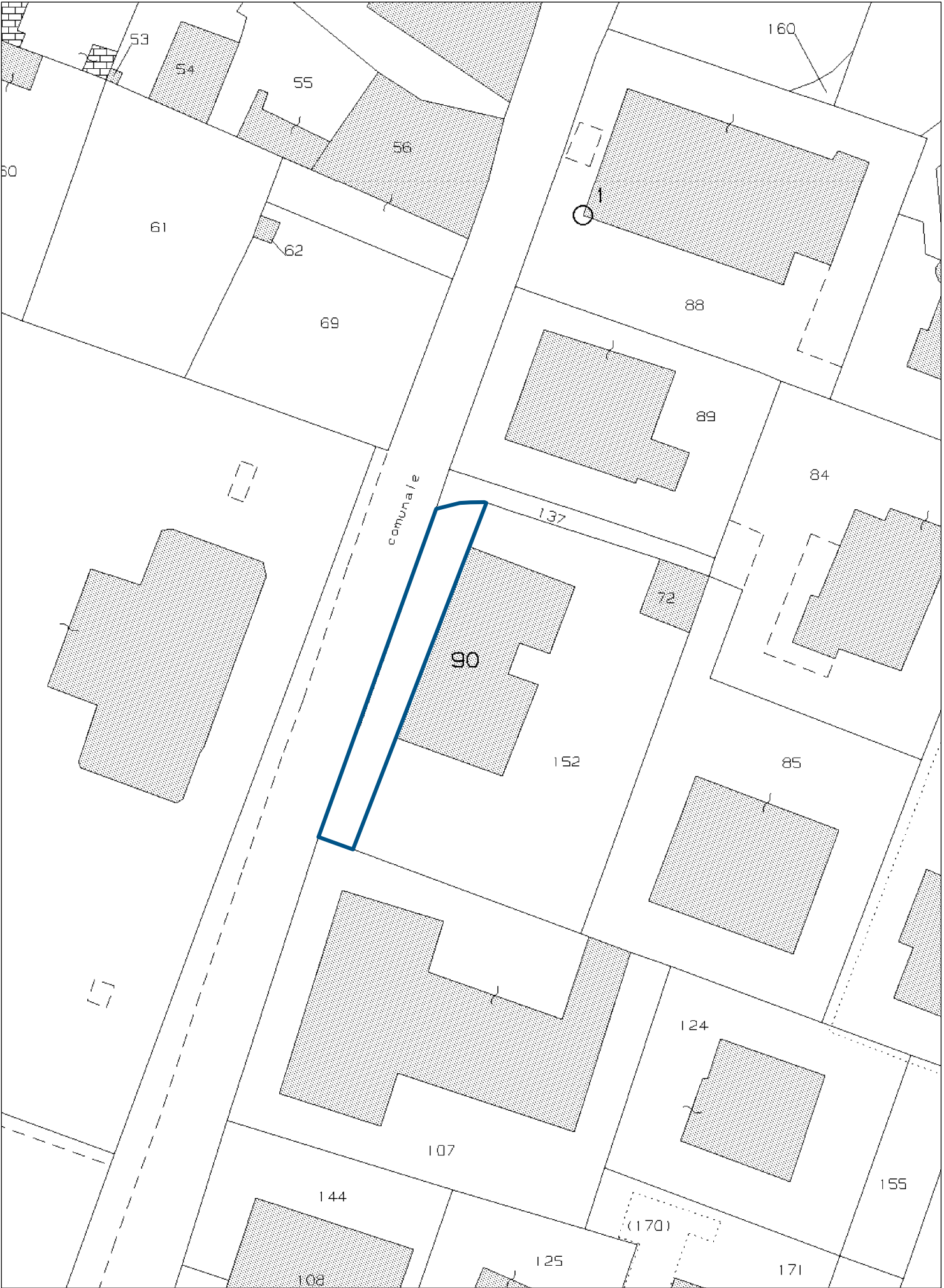
estratto mappa catastale scala 1:500