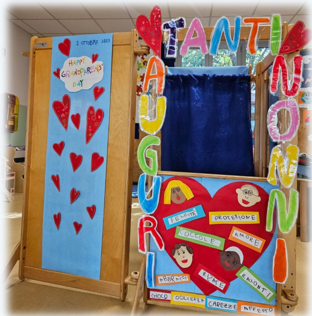
2 OTTOBRE FESTA DEI NONNI

SOSTENENDO E PROMUVENDO, ALCUNE GIORNATE PER NOI SIGNIFICATIVE