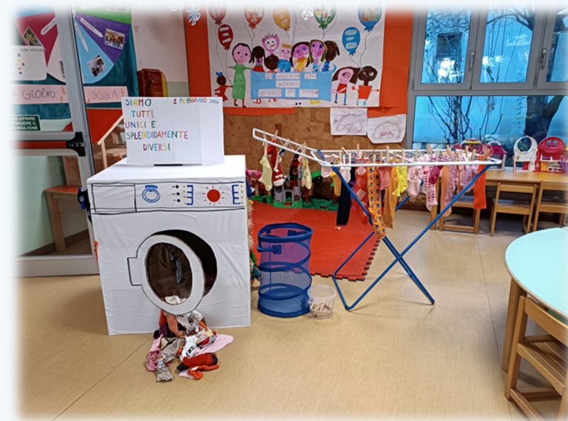
4 FEBBRAIO GIORNATA DEI CALZIANI SPAIATI