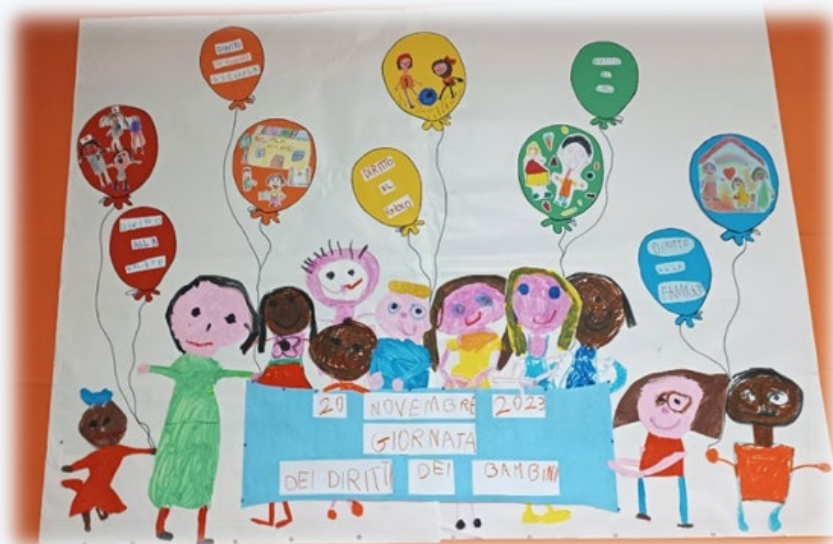
20 NOVEMBRE GIORNATA DEI DIRITTI DEI BAMBINI