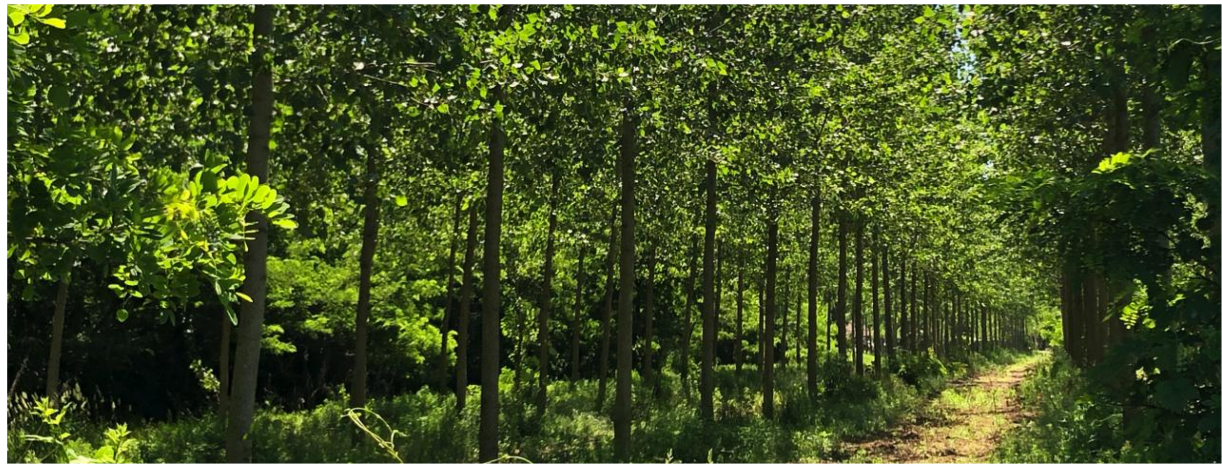
immagini di riferimento per trattamento aree a valore naturalistico