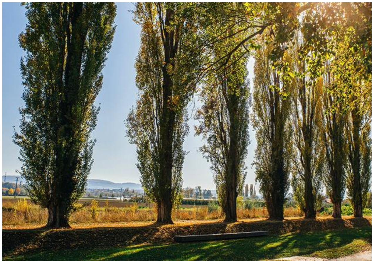
il corridoio verde esistente da potenziare - scatti lungo via Girelli