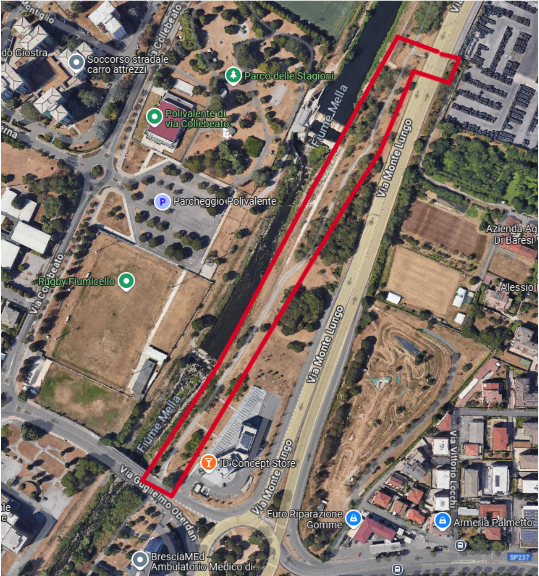
CICLOVIA DEL MELLA - TRATTO DI INTERVENTO 1