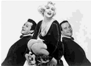
Il film. Le musiche saranno tratte dal celebre «A qualcuno piace caldo»