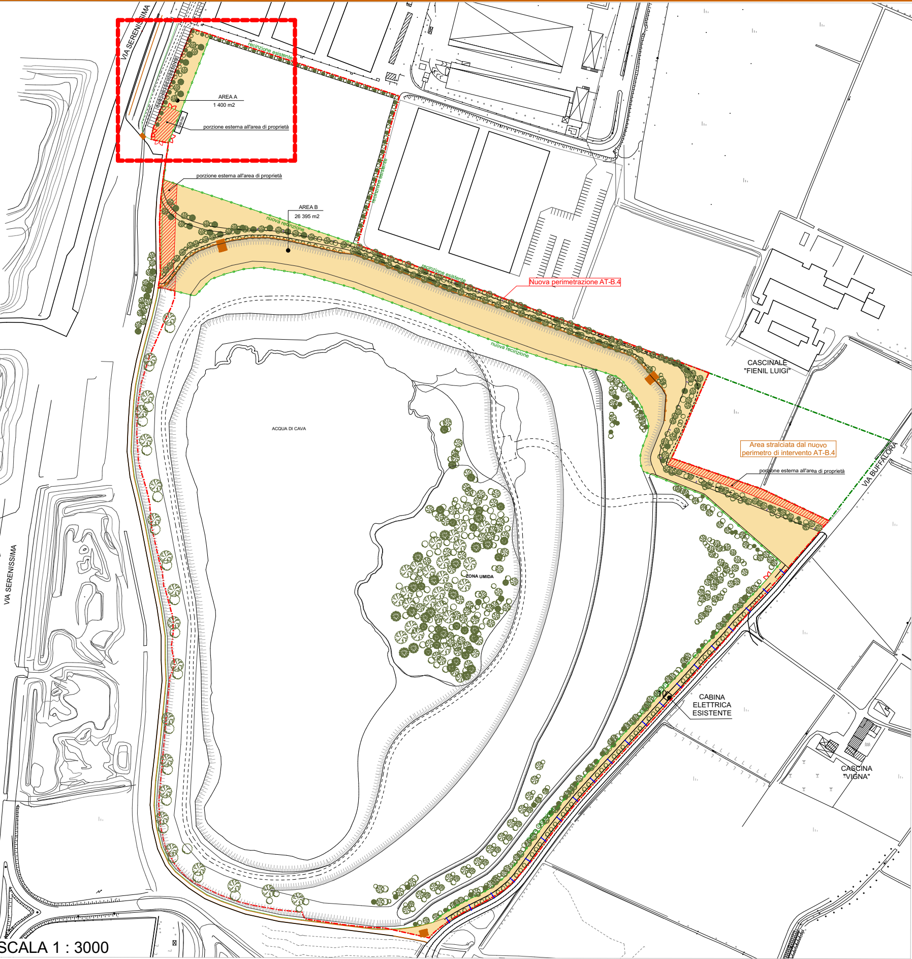
SCALA 1 : 3000