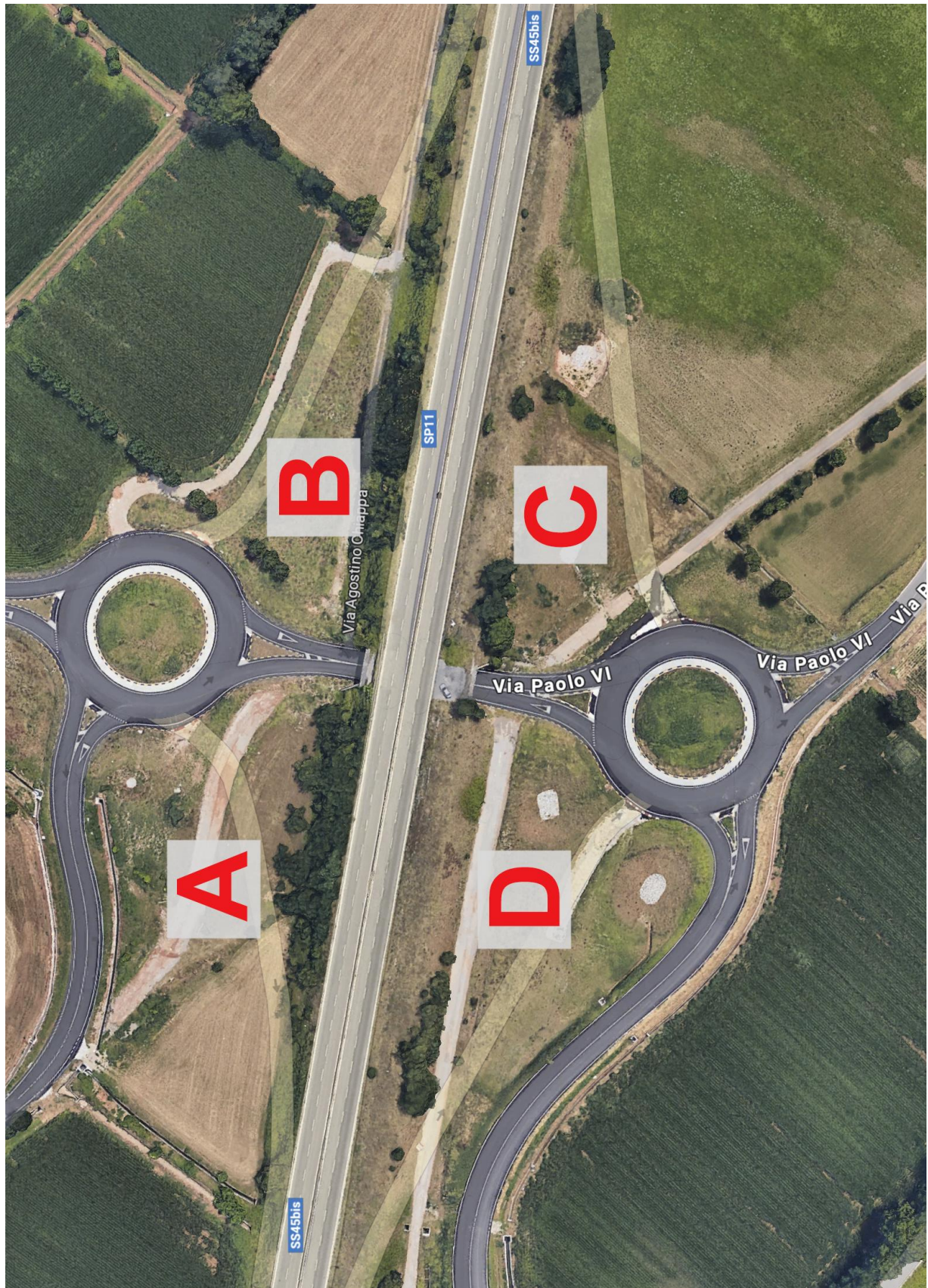
Fotografia aerea con aree di mitigazione