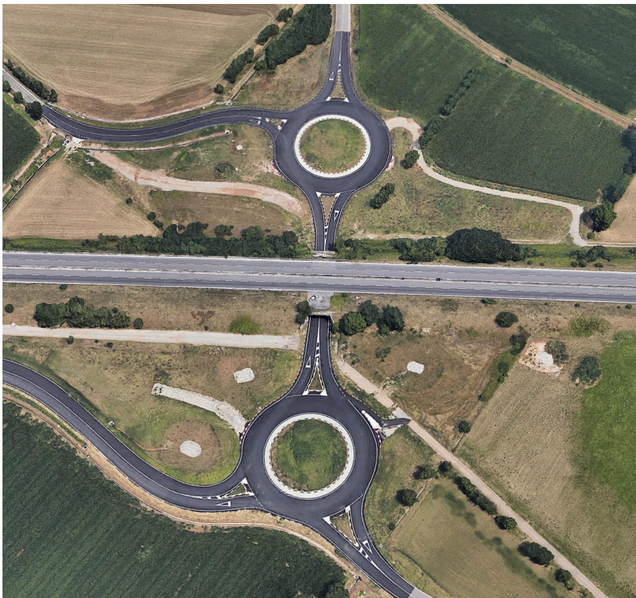
Fotografia aerea