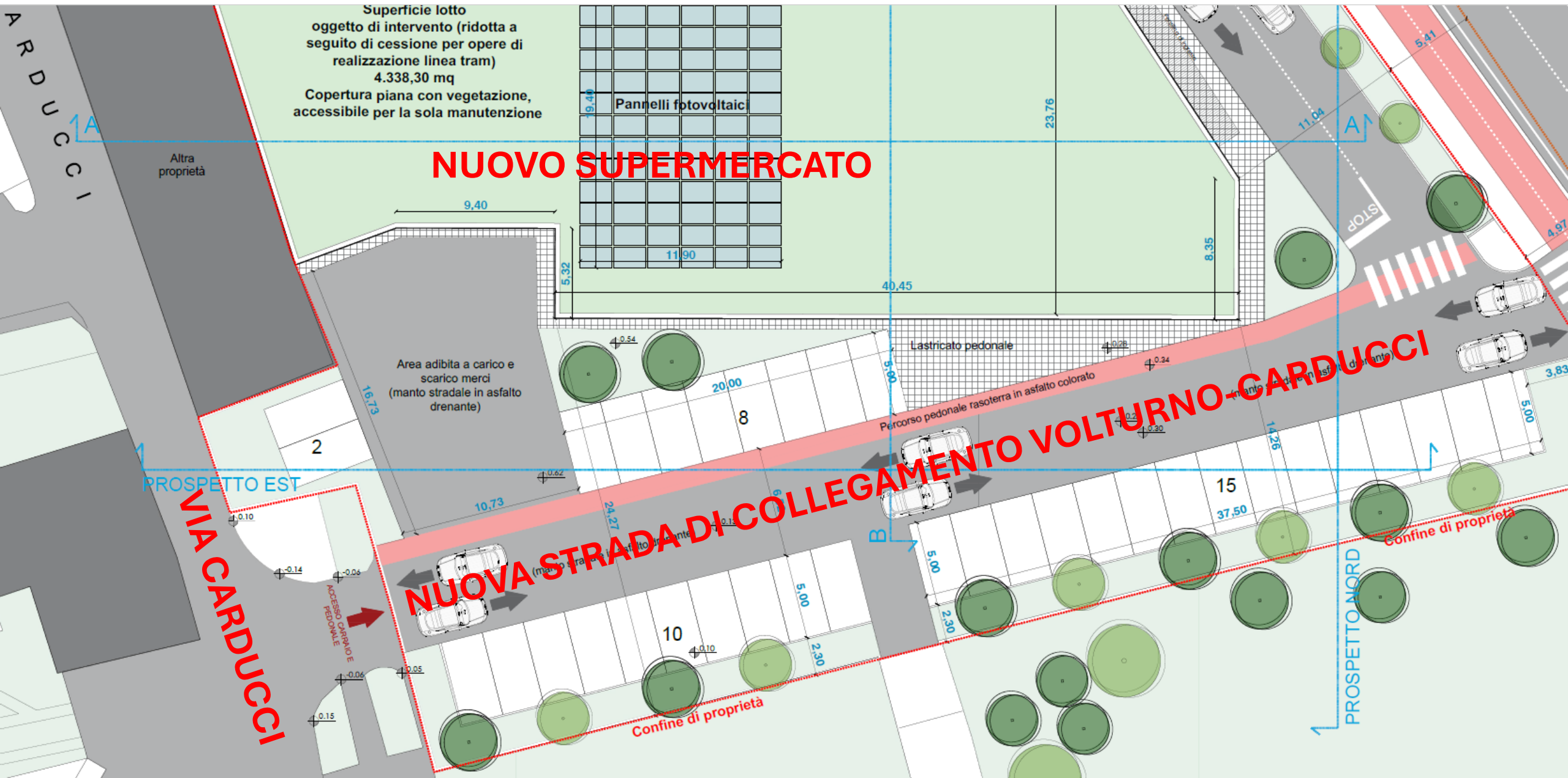
Tavola estratta dagli elaborati di progetto, integrata con mie note in rosso