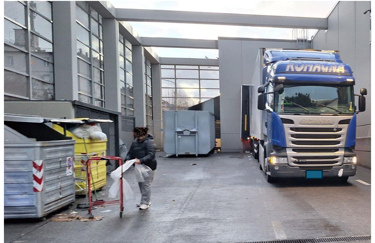
ALDI, 28/01/25 ore 07:44

Ciò creerà disturbo ai residenti nelle ore dedicate al riposo.