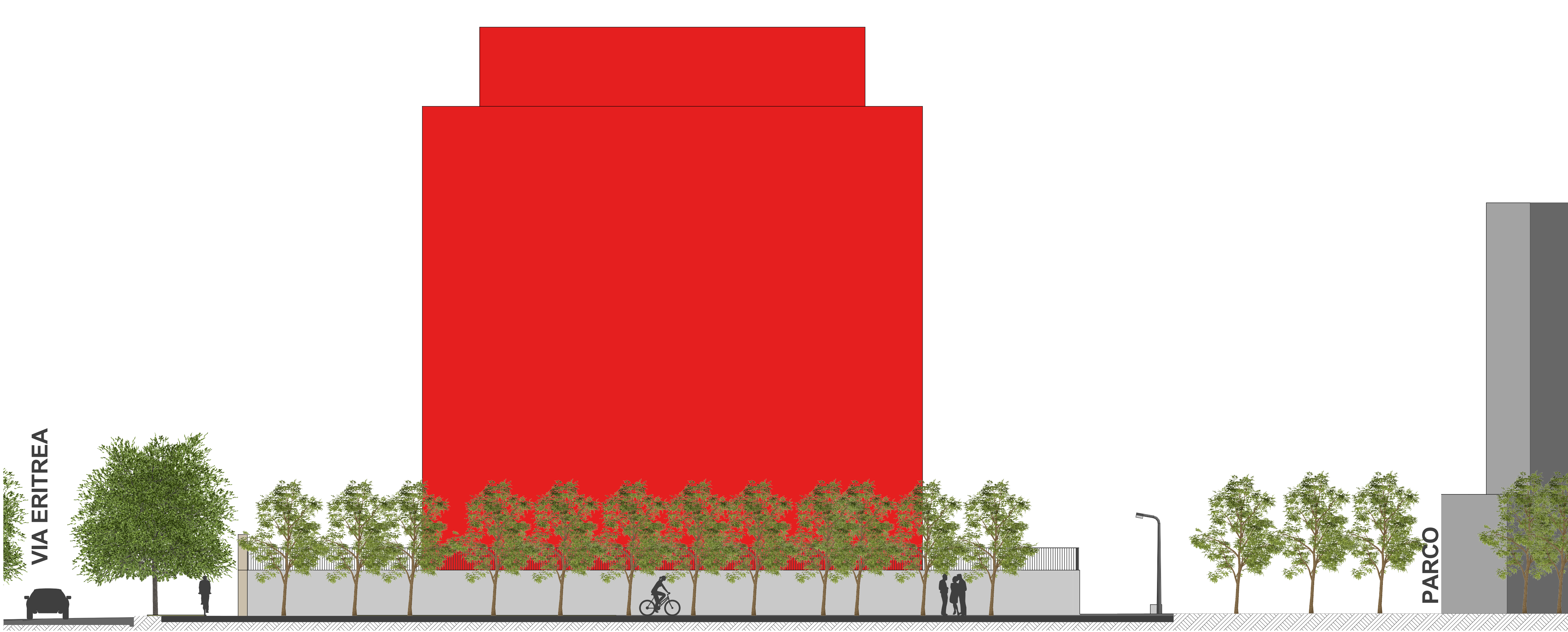
Dettaglio PIAZZA - Lotto 9 - Sezione A-A Scala 1:100