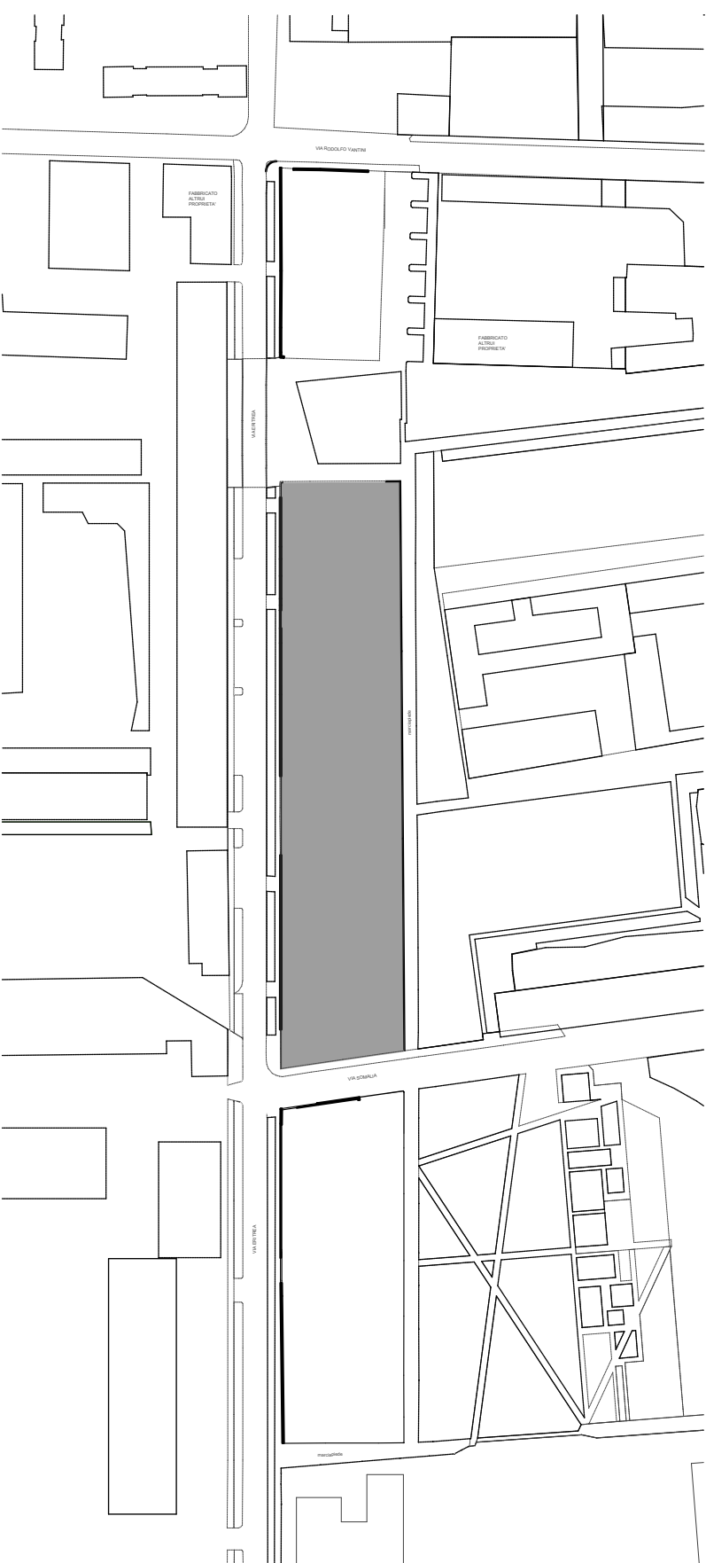
Key map: Individuazione lotti Scala 1:2000