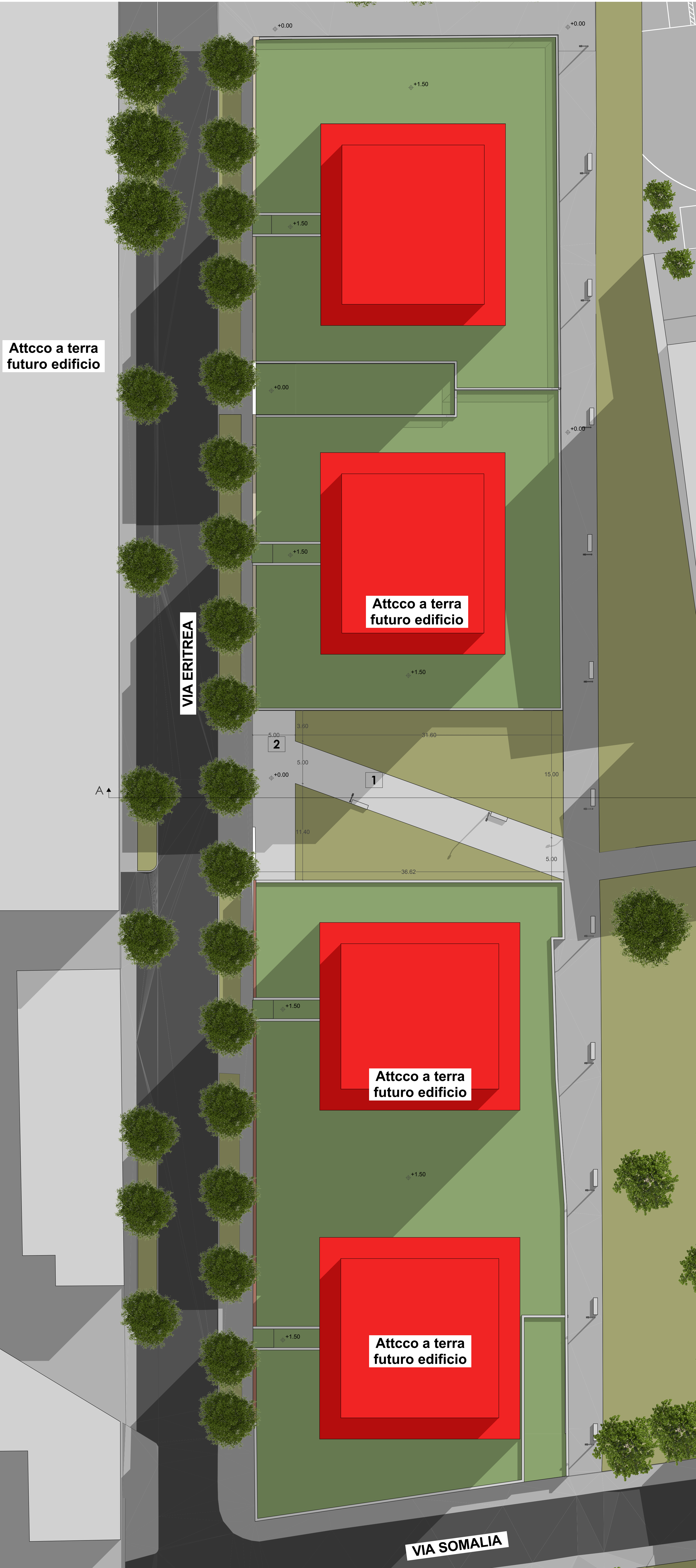
Planimetria progetto Scala 1:200