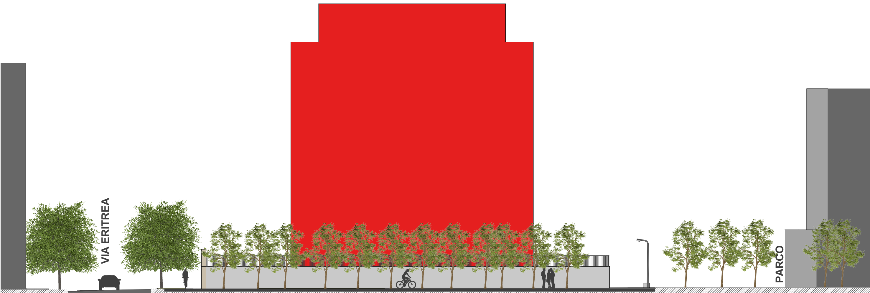
Dettaglio PIAZZA - Lotto 9 - Sezione A-A Scala 1:200