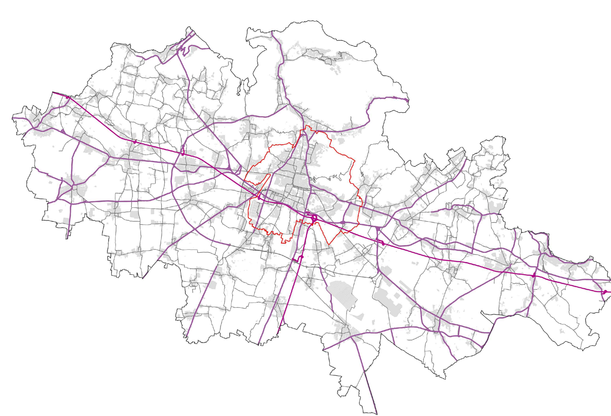
2 - SISTEMA DELLA MOBILITÀ ESISTENTE SU GOMMA